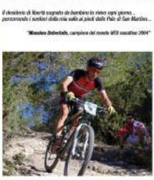
Il percorso di Monti sopra di Anzeno in nero ogni giorno, percorrendo i sentieri della rete verde di passi della Pila di San Martino. "Monte Dolomiti, campione del mondo MTB maschile 2004"