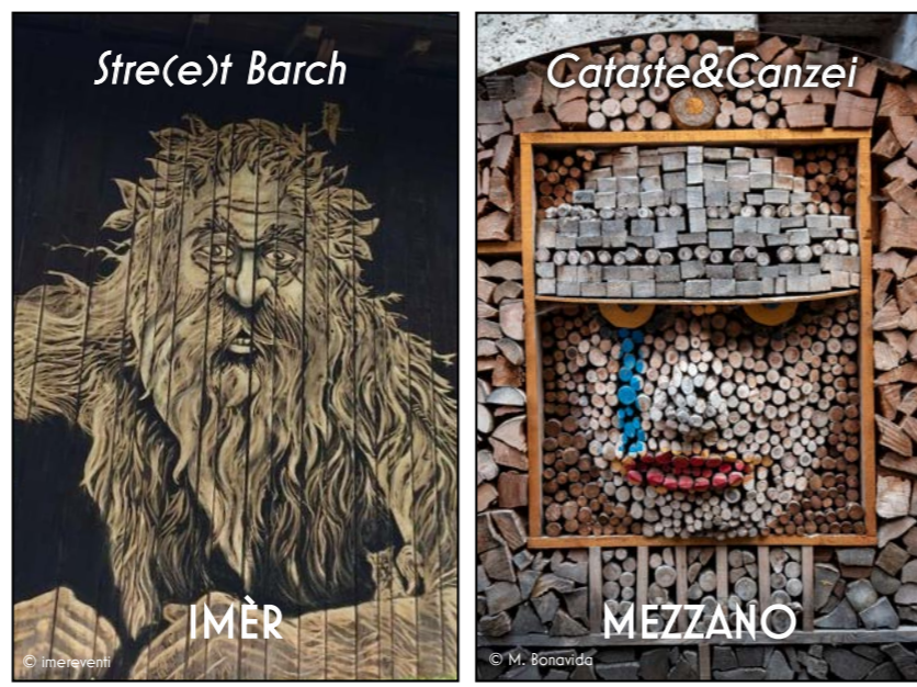
PERCORSI ARTISTICI TRA I BORCHI